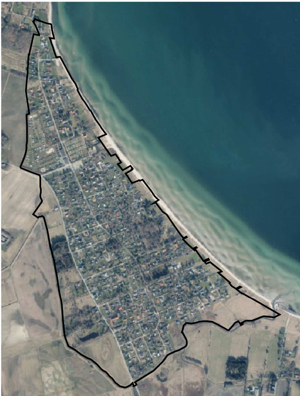
Figur 2, Luftfoto 2021 med områdeafgrænsning